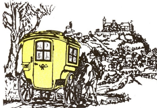
Markt Falkenstein Luftkutschert im Bayz. Wald